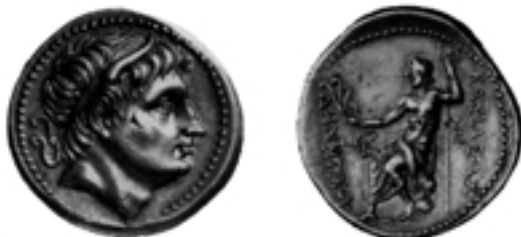
Taf. 13,3) Tetrachme des Demetrios Poliorketes, 17, 27 g, Amphipolis, ca. 291/290 v. Chr., E.T. Newell, The Coinage of Demetrius Poliocetes, London 1927, Nr. 112