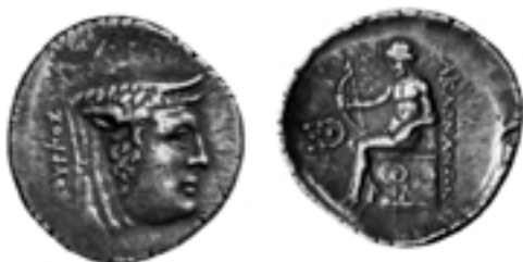
Taf. 13,5) Stater 229/168 v. Chr., 9, 87 g; BMC 6. Kopf des Flußgottes Acheloos nach rechts