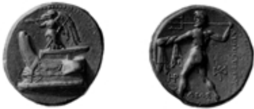
Taf. 13,1) Tetrachme des Demetrios Poliorketes, 16, 28 g, Tarsos, ca. 298/295 v. Chr., E.T. Newell, The Coinage of Demetrius Poliocetes, London 1927, Nr. 36