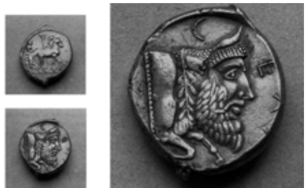
Taf. 13,4) Didrachme 500/480 v. Chr., 8, 49 g; Jenkins, Gela 34A. Flußgott Gelas nach rechts laufend