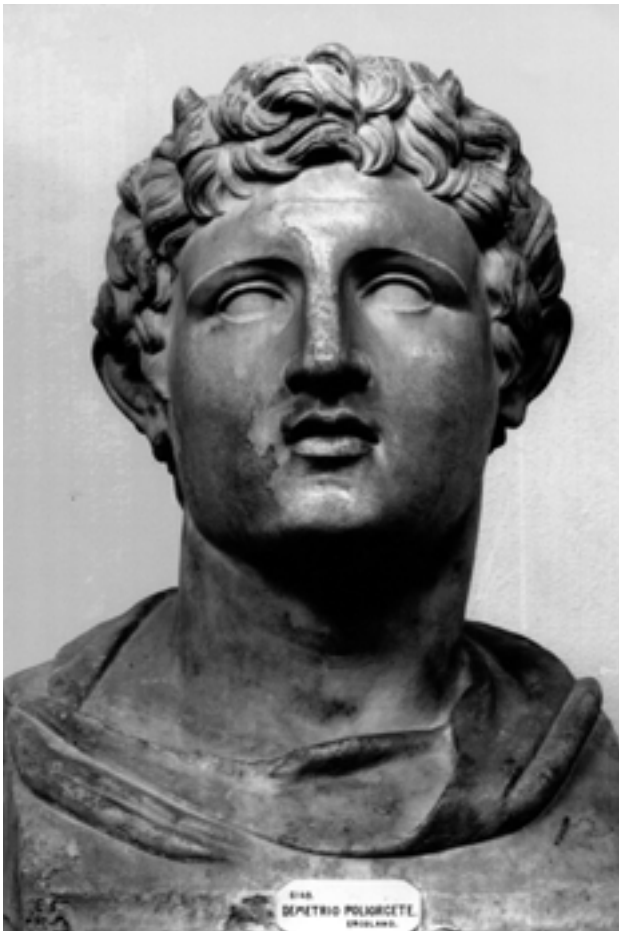
Taf. 14,1) Marmorbüste des Demetrios Poliorketes, H 33 cm, Neapel, Museum Nazionale. Römische Kopie eines Originals von ca. 290 v. Chr.