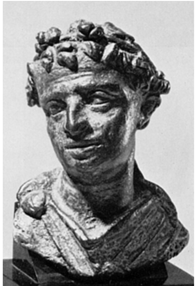
Taf. 14,2) Bronzebüste des Ptolemaios XII. Neos Dionysos, H 4,8 cm, 55- 51 Chr. Privatbesitz