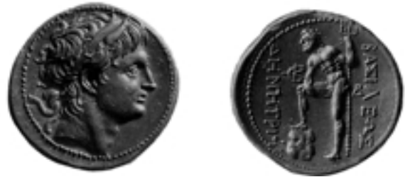
Taf. 13,2) Tetrachme des Demetrios Poliorketes, 17, 06 g, Euboia(?), nach 290 v. Chr., E.T. Newell, The Coinage of Demetrius Poliocetes, London 1927, Nr. 153